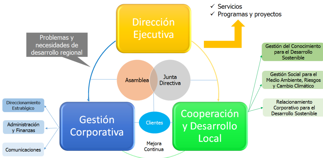
Gráfica No. 2. Modelo de Operación por Procesos de la Fundación Providence. Autor: Fundación Providence. Marzo del 2021.